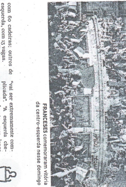
FRANCESES comemoraram vitória da centro-esquerda nesse domingo

Antes, esses blocos tinham, respectivamente, 150, 250 e 89 assentos. Outros partidos de direita ficaram